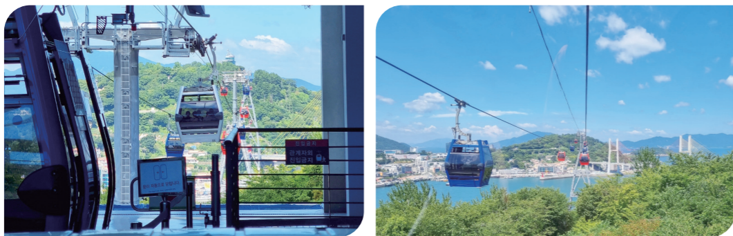
• 乘坐透明水晶丽水海上缆车将丽水大海尽收眼底