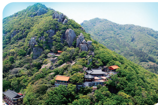
• 房建在悬崖上更神秘的向日庵 • 壬辰倭乱当时帮助忠武公李舜臣将军与倭寇作战的僧侣们的根据地向日庵建在海岸边垂直绝壁上，与奇岩绝壁之间郁郁葱葱的山茶等亚热带植物完美地融合在一起，成为该地区最美的景色。